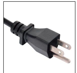
OPCIONAL: CLAVIJA AMERICANA _Voltaje 110v - 60Hz